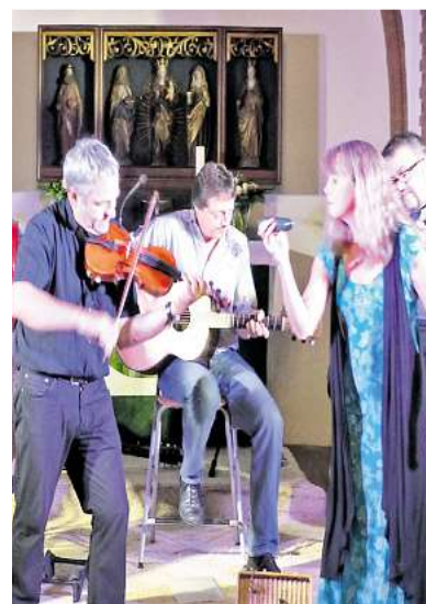
Emerald kommt zum zweiten Mal in die St. Barbarakirche.